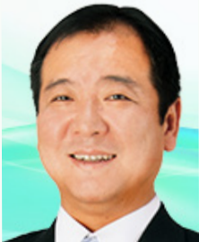
峯岸 良至 議員